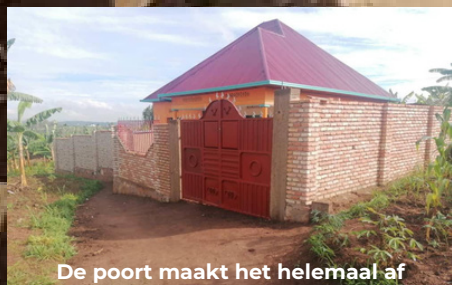
De poort maakt het helemaal af

Op je eigen plek liefde, geluk en perspectief geven! Wie wil dat nou niet??