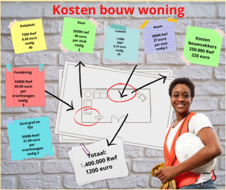
Een globale berekening van de bouwkosten van een huisje

Veel kinderen die bij het Oranjehuis komen hebben een thuis. Een thuis waar zij vaak alleen met hun moeder en/of broertjes en zusjes wonen. De woningen zijn vaak in erg slechte staat. Wanneer het regent is het binnenshuis net zo nat als daar buiten. Er zitten gaten in het dak, en de muren zijn vaak onstabiel en aangetast door de grillen van het weer en goedkope bouw. Dit levert gevaarlijke situaties op. Het huis kan instorten met alle gevolgen van dien. In het regenseizoen gebeurt dit helaas vaak. Om ook voor deze kinderen een veilige thuis te bieden hebben wij een bouwfonds opgericht. Vanuit de bouwfonds kunnen er reparaties aan huizen verricht worden. Hierdoor kunnen de kinderen en hun families droog blijven als het regent. Dit zijn kleine reparaties die door plaatselijke bouwvakkers zullen worden uitgevoerd. In de toekomst willen wij meer doen door bijvoorbeeld simpele maar stevige en leefbare huisjes te gaan bouwen.